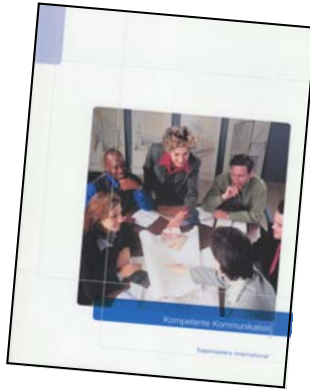
Unser Handbuch: In 10 Schritten zu besseren Reden

Bei den HanseRednern geht es um nichts anderes: Jedes unserer Treffen sind zwei hochaktive Stunden voller Reden. Dazu arbeiten wir mit einem Handbuch, das Sie in 10 Schritten zu einem kompetenten Redner macht.